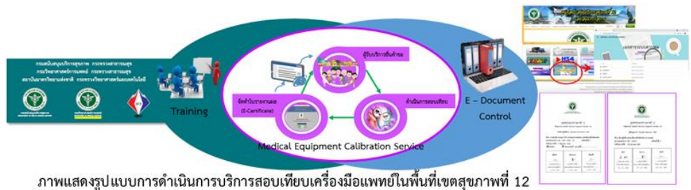
ภาพแสดงรูปแบบการดำเนินการบริการสอบเทียบเครื่องมือแพทย์ในพื้นที่เขตสุขภาพที่ 12